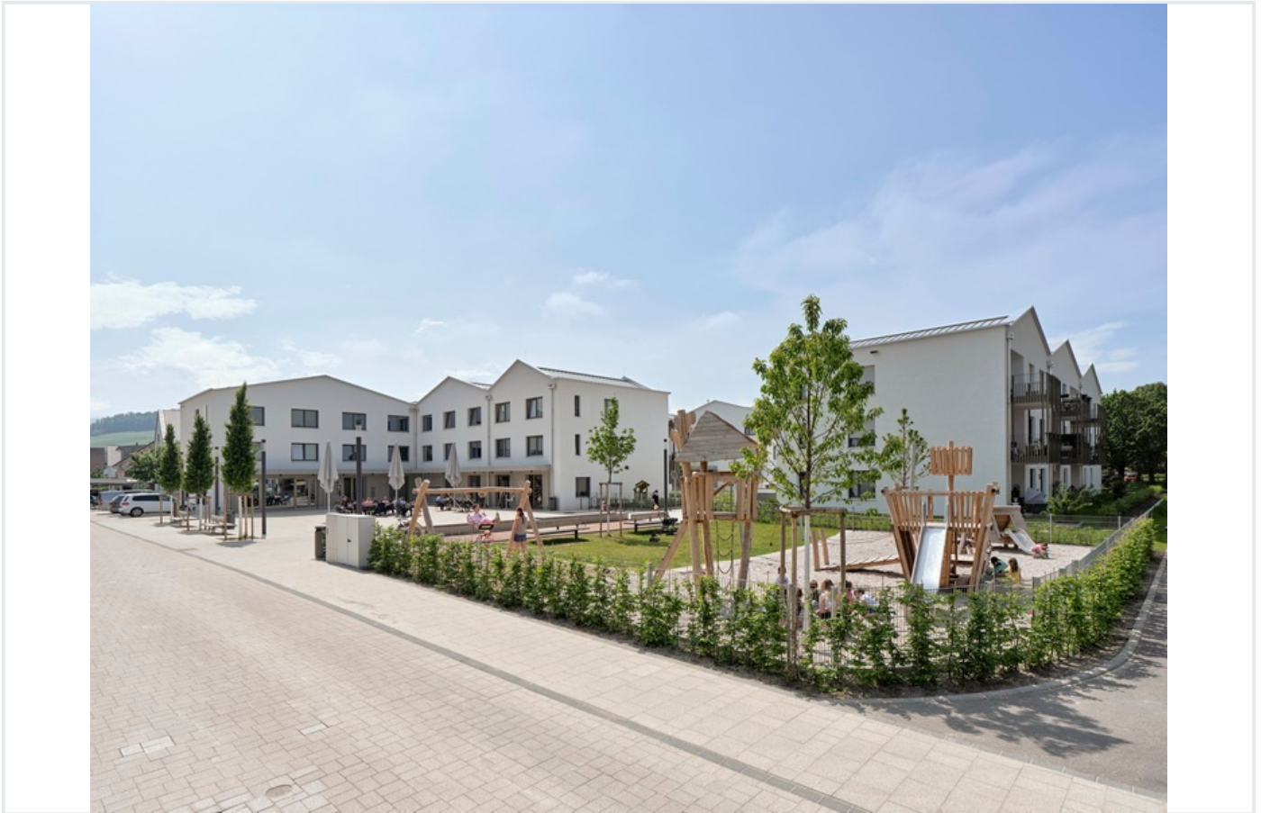
Schallstadt_Auf der Viehweid 01.JPG