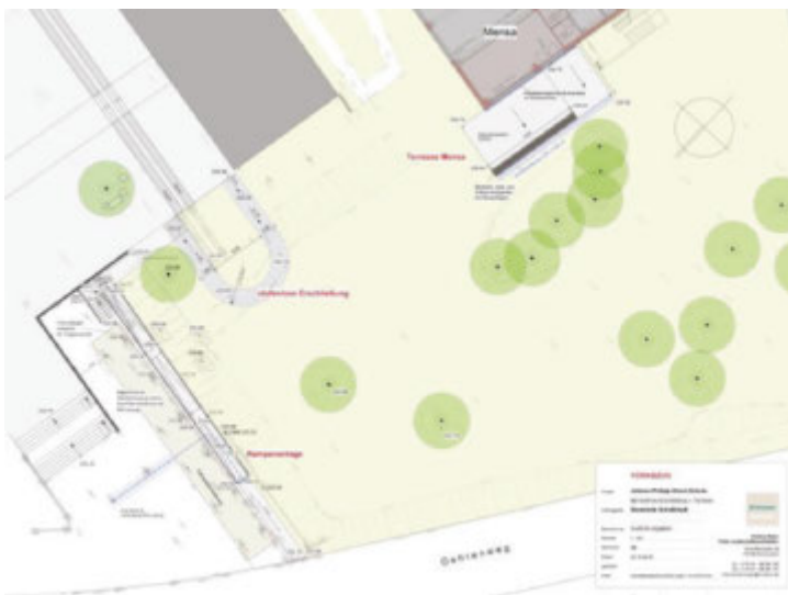
Plan zur barrierefreien Erschließung des Schulhofes

Für die langjährige und sehr professionelle Kernzeitbetreuung sowie notwendige zusätzliche Klassen- und Werkräume der Außenstelle der weiterführenden Jenger-Schule wurde vor kurzem ein barrierefreies Gebäude fertig gestellt. Das Außengelände mit einer barrierefreien Andienung vom Gehrenweg auf das Areal befinden sich noch in der Umsetzung. Gleiches gilt für eine Um- und Neugestaltung des Schulhofes bzw. des östlichen Freizeitbereichs der Schule. Gesamtinvestitionssumme der Mensa ca. Euro 2.000.000.