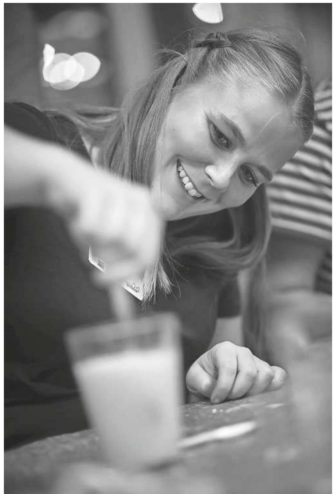
PM_41_archivfoto1_HdkF_FoBi_Präsenz.jpg; PM_41_archivfoto2_HdkF_FoBi_Präsenz.jpg