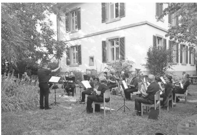
Ihr Musikverein Mengen e.V.

Am vergangenen Sonntag fand unser kleines Gartenkonzert im Pfarrgarten in Mengen statt. Trotz des unbeständigen Wetters, meinte es Petrus gut mit uns und schloss seine Schleusen, um uns ein schöner Abend zu bereiten. Uns hat es sehr viel Freude bereitet, dass es viele Mengener angenommen und uns zugehört haben. Für uns war es ein kleines schönes Konzert, mit dem wir uns in unsere Sommerpause verabschieden. Wir bedanken uns ganz herzlich bei der Kirchengemeinde Mengen-Hartheim für die Überlassung des Pfarrgartens und allen Besuchern für ihr Kommen und Ihre Spende.