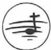
NIGHT OF SONGS

Ausführlichere Informationen zu weiteren Gottesdiensten und allen Veranstaltungen der SE finden Sie auf der Homepage ( www.kath-bom.de ) oder im Pfarrbrief.