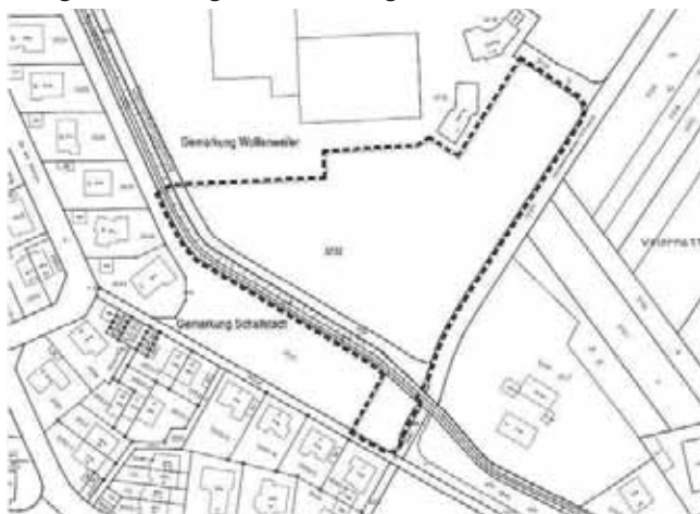
Übersichtsplan mit Plangebiet (Geltungsbereich) ohne Maßstab

Für den Planbereich ist das Plankonzept vom 24. Januar 2017 maßgebend. Er ergibt sich aus folgendem Planausschnitt: